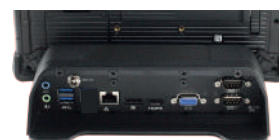
Station de bureau