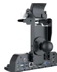
Station d'accueil mobile