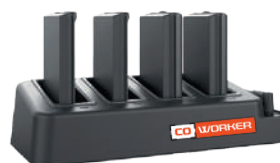
Chargeur de batteries