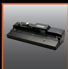
Station d'accueil pour bureau