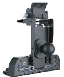
Station d'accueil mobile