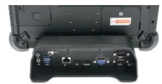
Station de bureau