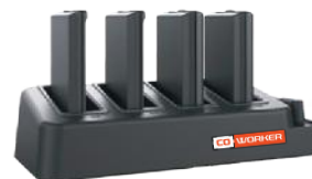
Chargeur de batteries