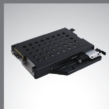
Baie multimédia 2ème stockage 2ème batterie