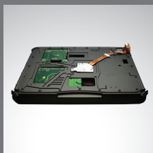
PCI/PCI-Express 3.0 Unité d'extension